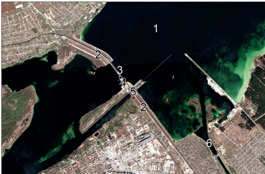
Рис. 6.48. Супутниковий знімок Каховського гідровузла перед руйнуванням: 1 — Каховське водосховище; 2 — ліво- та правобережна земляна гребля; 3 — бетонний водоскид; 4 — будівля ГЕС; 5 — шлюз; 6 — водозабір Північнокримського каналу

11 листопада 2022 р. Збройні сили України звільнили м. Херсон та інші населені пункти на правобережжі Дніпра. Того ж дня ворожі війська,