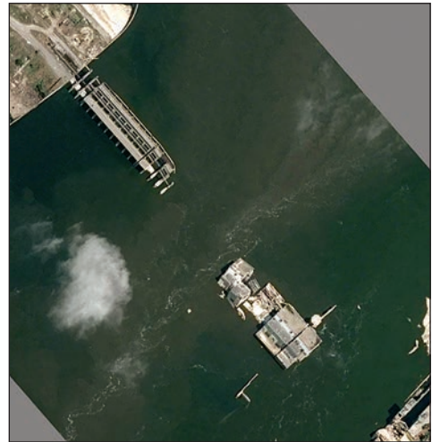
Рис. 6.50. Зруйнований Каховський гідровузел: ліворуч — 06.06.2023 р., недовзі після вибуху; праворуч — 07.06.2023 р.