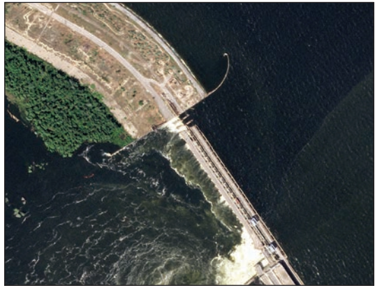
Рис. 6.49. Супутниковий знімок греблі Каховського гідровузла перед руйнуванням

Після руйнування греблі рівень води нижче за течією почав швидко підвищуватися. Якщо на 4:00 6 червня рівень води на гідрологічному посту в Херсоні становив 0,35 м над рівнем моря, то через чотири години, о 8:00, він досяг 1,60 м. Наступного дня о 8:00 він уже дорівнював 5,29 м. Максимальний рівень (5,68 м) було зафіксовано 8 червня 2023 р. о 3:00. Загальний підйом рівня води досяг 5,33 м (рис. 6.51).